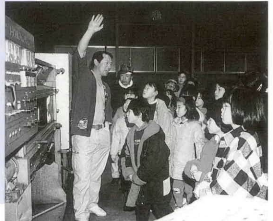
熱心に説明を聞く子どもたち