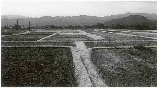
本年度着工予定の牧戸地区ほ場

水プール・鏡」の完成によりその全容が整い、町民の方々はもとより広範にわたって、町内外の交流の場として愛されつつける施設であることを祈念する次第です。