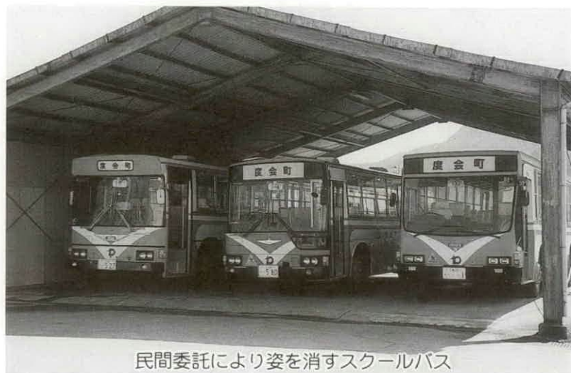
民間委託により姿を消すスクールバス

昭和五十一年四月開校以来、遠距離通学生徒については、生徒の安全かつ能率的・経済的な運行管理を目的に、長年にわたり直営方式によるスクールバスの運行をしてまいりましたが、このたび、スクールバスの運行業務について、生徒のより一層の安全な輸送、将来の維持管理の面、また、生徒数の推移等を考慮しながら度重なる協議の結果、平成八年四月一日からその業務を、