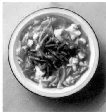
豆腐の和風カレー煮