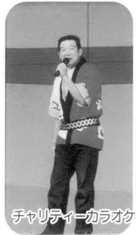
チャリティーカラオケの様子

カーニバル「宮リバー夏のつどい'98」が開催されました。このイベントは、川の日（毎年7月7日）に併せて実施されたもので、好天に恵まれた当日は、多くの家族連れが詰めかけ楽しい夏の一時を満喫していました。