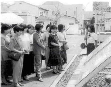
説明に聞き入る婦人会のみなさん

現在の技術では、管内の全戸に太陽光発電設備を設置しても、総発電量の6・5%ほどしかカバーできないといった試算の報告もされましたが、二酸化炭素排出の抑制など、地球環境にやさしいエネルギーとして、さらに研究が進むことを期待したいものです。