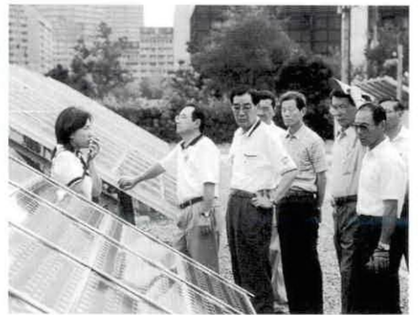
太陽光発電を見学する区長さん

50名の一行は、車中で、きびしいエネルギー事情、地球温暖化、酸性雨、新エネルギーの開発状況などの予備知識を得たうえで、実験センターを見学しました。