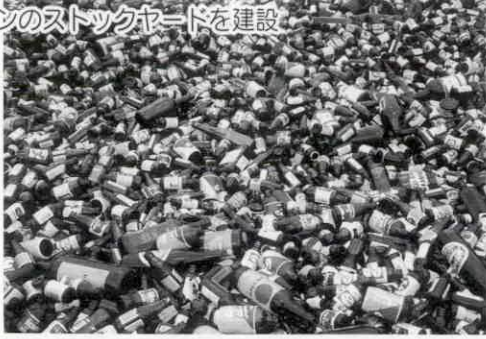
空きビンのストックヤードを建設