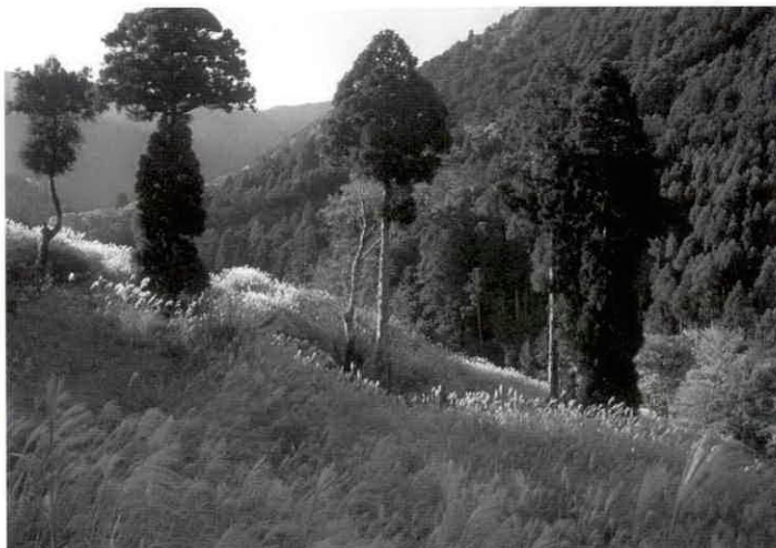
撮影場所…川口萱場

飼えなくなった犬の引取日 8月19日(水) 印鑑を御持参の上 午前9:30までに役場へお願いします。