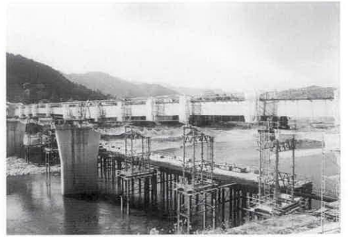
内城田大橋掛け替え