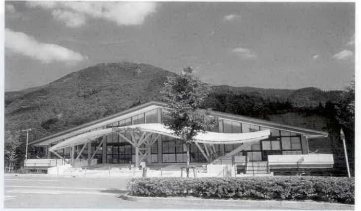
パザールわたらい

平成9年度の度会町一般会計及び特別会計の歳入歳出決算が、平成10年第4回度会町定例会で承認されました。