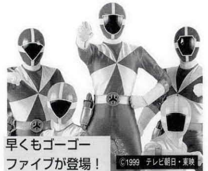
早くもゴーゴーフাইブが登場!

度会町役場企画課内 宮リバー度会パーク春まつり実行委員会事務局 ☎ 62-11111(代)