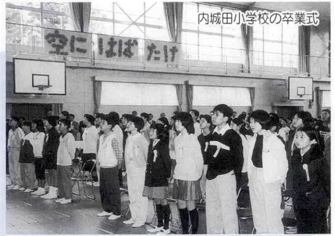
内城田小学校の卒業式

去る3月18日、町内の各小学校では卒業式が開催され、111名がそれぞれの小学校での思い出を胸に卒業を迎えました。