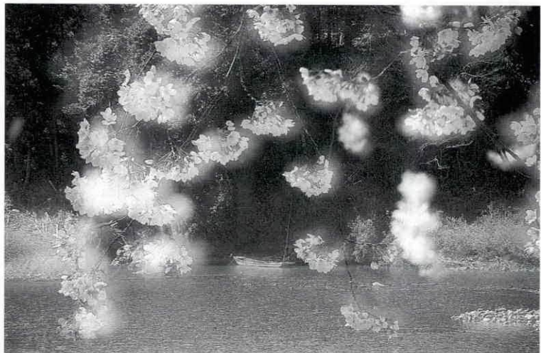
撮影場所…宮リバー度会パーク