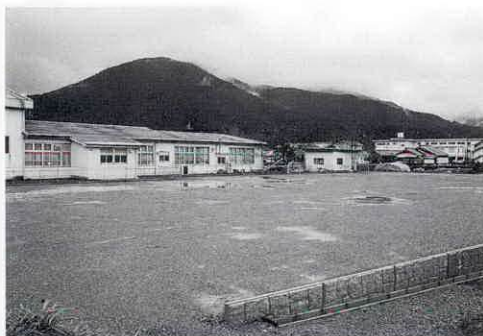
造成された 柵橋保育所増改築用地