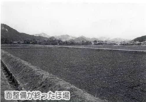
面整備が完了したほ場

そんな中、当町においては昭和55年の第3期山振事業を手はじめとして、20年近い歳月を費やした「ほ場整備事業」が、10年度で「面整備」が達成される運びとなりました。20年来の懸案事項の達成だけに感慨もひとしおです。関係者皆さまのご理解とご協力に感謝しています。 11年度の予算編成は、一般会計の当初予算につきましては、政策的経費を極力抑え、義務的経費を中心とした「骨格予算」として編成いたしました。他の簡易水道事業をは