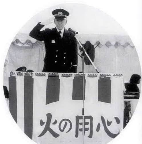
敬礼をする大野町長