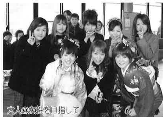
大人の女性を目指して