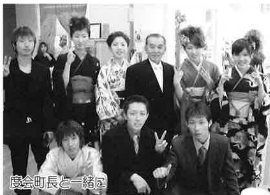
度会町長と一緒に