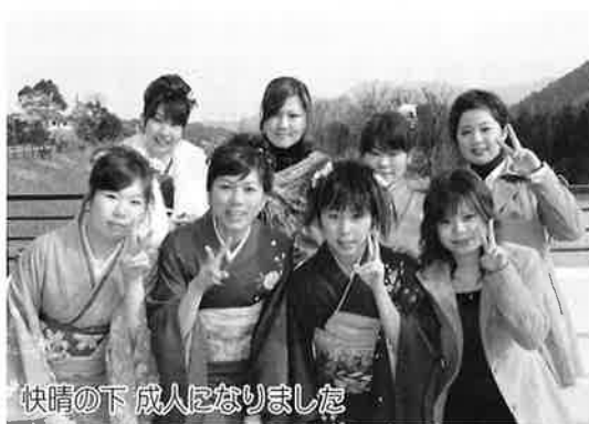
快晴の下 成人になりました