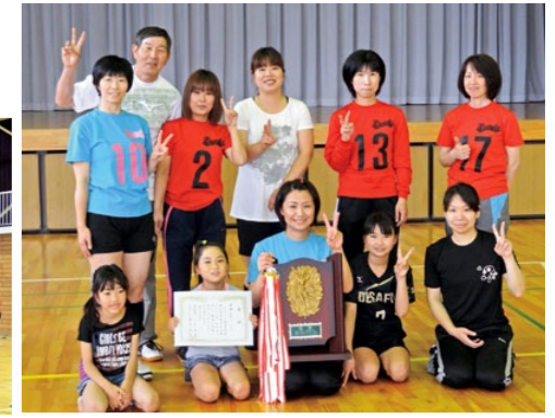
優勝したラブリー