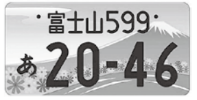
富士山ナンバー (参考)

※複数のモチーフの使用もできます。 ※自作の未発表で、第三者の著作権、商標権などの権利を侵害しないものに限りします。