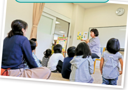
#読み聞かせボランティア

また、今後について、「いつまでも頑張る気持ちは変わりませんが、年齢を考えると限界もあります。私たちの活動に加わる人が増え、地域学習の機会を引き継いでいってほしいと思います」と語ってくれました。