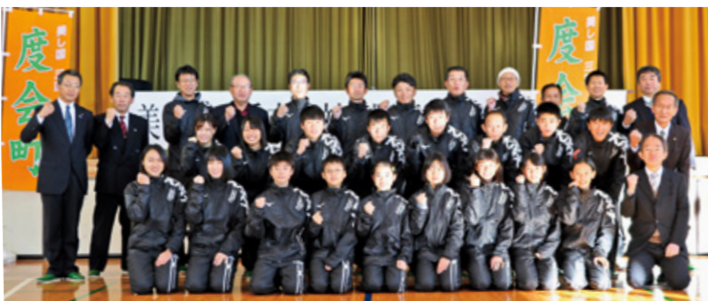
【問合せ先】町教育委員会事務局 ☎ 62-2422

市町間の交流・連携の促進とスポーツに対する県民意識の高揚を目的に、2月17日(日)に『三重とこわか国体・三重とこわか大会開催決定記念 第12回美し国三重市町対抗駅伝』が開催されます。 この駅伝に向けて、度会スポーツクラブと共同し、内城田スポーツクラブや度会中学校陸上競技部の皆さんとそのOBなどで町チームが結成されました。