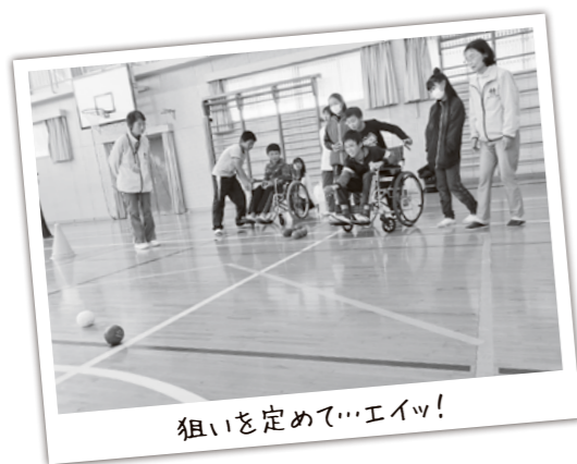
狙いを定めて…エイッ!

最後に、「私たちの仕事は、『人権を守る』『幸せを守る』お手伝い。悩みを相談できる人は、家族や先生、友だちのほかに、人権擁護委員もいることを覚えておいてほしい」と説明があり、「卒業してからも仲間を大切にしてください」とエールをいただきました。