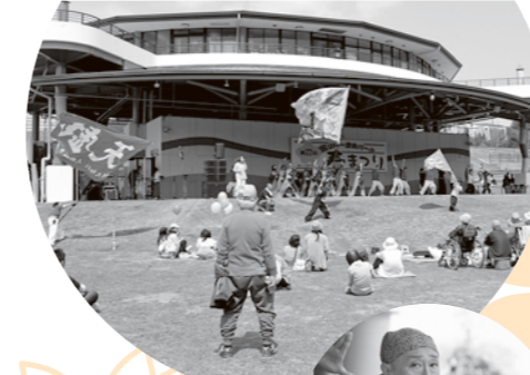
昨年のおたのしみステージ