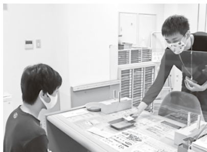
前回休日開庁時の様子