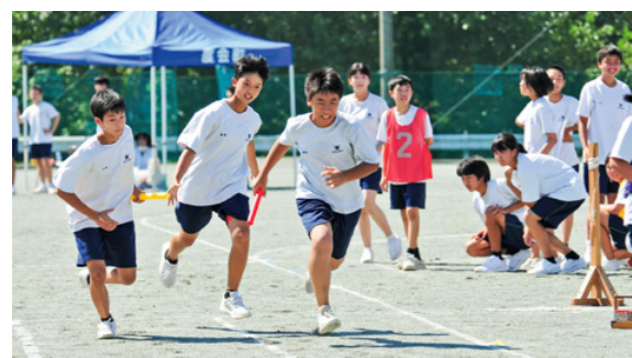
離れた場所からの応援