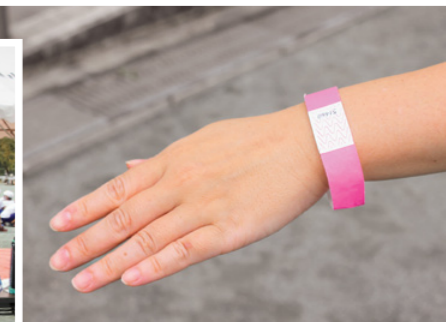
リストバンドによる来場者の把握

9/26 今年は、小・中学校とも新型コロナウイルス感染症対策のため、時間の短縮、校内数力所にアルコール消毒液の設置、競技中以外のマスクの着用、互いの