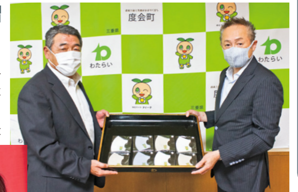
左から中村町長、村田社長