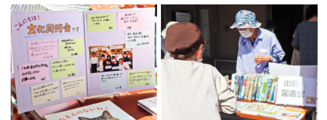
寄せ書きと貸出図書