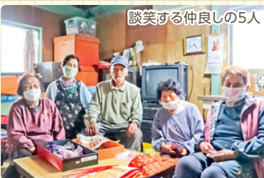
談笑する仲良しの5人