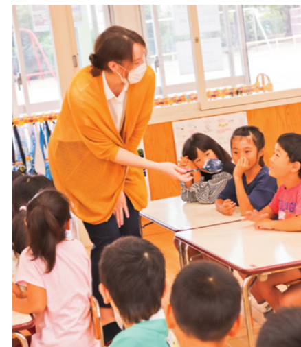
[What's your name? ]の質問に答えてみる