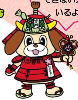
たまきちやう 玉城町「たままるくん」

ちやくよう マスクの着用 は大切だけど、 びやうきなどの事情で できない人も いるよ。