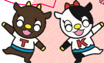
たいきちやう 大紀町「たいちゃん」「きーちゃん」

じぶん やたいせつ かぞく 自分や大切な家族 が感染するかもし れないよ。他人事 じゃないね。