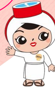
しまし 志摩市「しまこさん」

しんがた 新型コロナウイルス感染症について、不当な差別や偏見、デマの拡散は人権侵害です。また、これらの行為は、 ひとひと 人々を不安にし、感染拡大防止の妨げにもなります。不確かな情報に惑わされず、正しい情報に基づく冷静な 行動をお願いします。相手の気持ちになって考え、みんなで“差別のない社会”をつくりましょう。