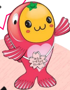
みえみえせつ 南伊勢町 「たいみー」

かんせん ひと 感染した人や その家族に対する ひぼう ちゅうしょう 誹謗・中傷は ゆる 許さないよ。