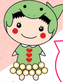
とほし 鳥羽市「ジュジュ」

けんがい らいびやうしや 県外からの来訪者 や、県外ナンバー 車両への嫌がらせ はやめて！