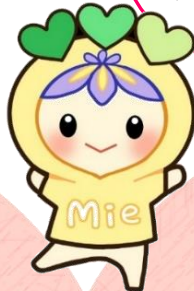
みえけんじんけん 三重県人権センター 「ミッコロ」

かいがい きこくしや 海外からの帰国者や がいこくしゅうしんしや 外国出身者への偏見 や暴言はやめて！