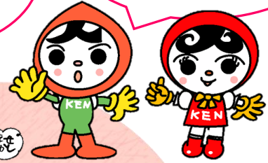
ほつむ 法務局「人KENまもる君」「人KENあゆみちゃん」

かいがい きこくしや 海外からの帰国者や がいこくしゅうしんしや 外国出身者への偏見 や暴言はやめて！