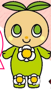
わだらいちやう 度会町「ティーナ」

ちやくよう マスクの着用 は大切だけど、 びやうきなどの事情で できない人も いるよ。