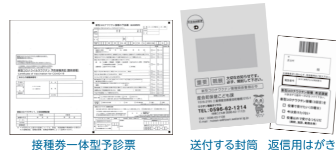
接種券一体型予診票

◎はがきに「役場以外で受けるつもりだ」「今は受けたくない」と記入された場合でも、令和4年5月までにご連絡をいただければ、役場での接種が可能です。