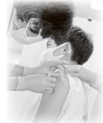
ワクチン接種の様子