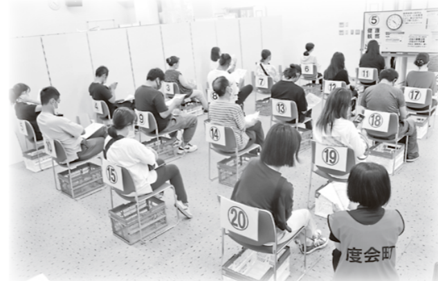
ワクチン接種後の経過観察