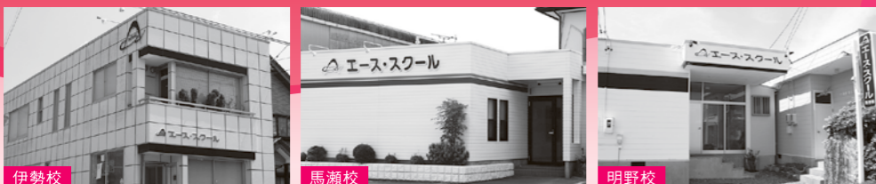
伊勢校 馬瀬校 明野校