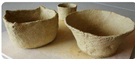
できあがった縄文土器（鉢形土器）