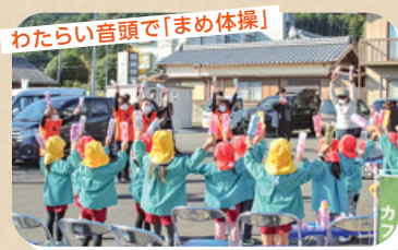
世代を超えた交流の場となりました。