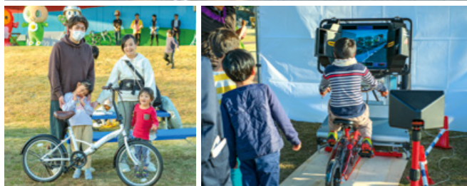
抽選で当選した自転車