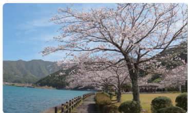
紀北町「紀伊長島片上池コース」