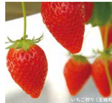
いちご狩り (玉城町)