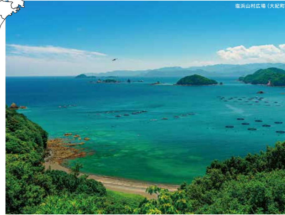
塩浜山村広場 (大紀町)

\\ 次の休みに“ふたり”で行きたい! // おすすめ デート Date Spot スポット