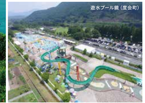
遊水プール鏡 (度会町)