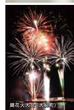
錦花火大会 (大紀町)