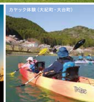
カヤック体験 (大紀町・大台町)